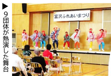
9 団体が熱演した舞台

これからも地域の発展と心豊かなふれあいを深める場として「富沢ふれあいまつり」を続けていきたいと思ひます。