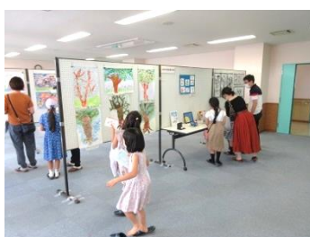
家族揃って作品を鑑賞

お客様同士の 間隔の確保や 十分な換気、 お客様の連絡 先把握、定員 の管理等、 感染防止対策 を行いました。