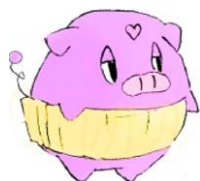
八木山市民センターのトリュフ君