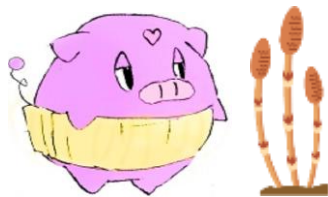
八木山市民センターの キャラクター トリュフくん