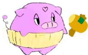
八木山市民センターの キャラクター トリュフくん