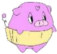
八木山市民センターの キャラクター トリュフくん