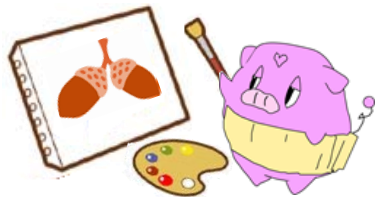
八木山市民センターの キャラクター トリュフくん