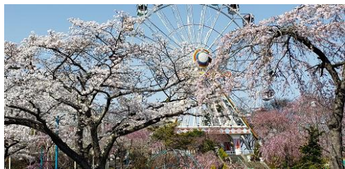
八木山ベニーランドの桜