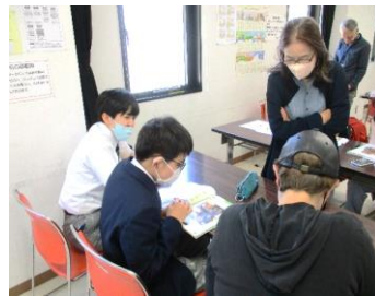
日本語ティールームでは外国籍やボランティアの方々と交流しました