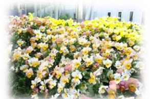
ピンクや黄色、紫のビオラ