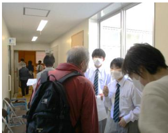
八木山シニア大学にて受付のお手伝い

『第40回 全国都市緑花仙台フェア 未来の杜せんだい 2023～Fee | green!～』が開催となり、仙台がたくさんの花で彩られています。仙台市市営地下鉄東西線、「八木山動物公園駅」前にあります駅前ガーデンもキレイな花で彩られております。是非、足を止めて見てみてください。