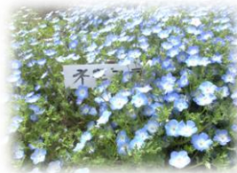
小さな青い花が可愛い らしいネモフィラ