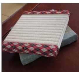
素敵に出来上がりました