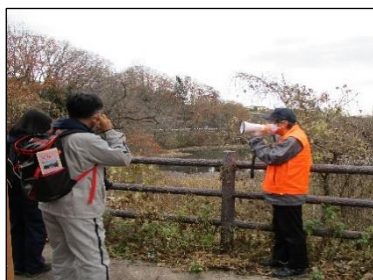
中溜池の説明を聞く参加者

市民センターを出発して、昔灌漑用水として使われた五つの溜池を見ながら、秋保電鉄軌道跡に沿って隧道跡まで約3kmを歩きました。参加者からは、「今までよくわからなかった秋保電鉄軌道跡や溜池について知ることができ、非常に良かったです。」などの感想がありました。