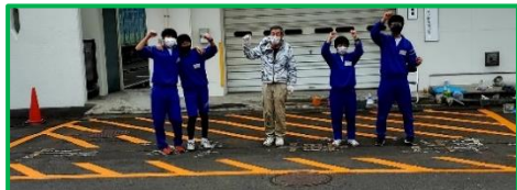
駐車場のゼブラ塗装