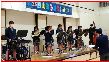
仙台西高校・吹奏楽部の演奏