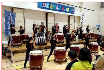
「飛竜の会」による開演太鼓