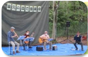
G' z 4