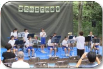
人來田中学校吹奏楽部

9月16日(土)、楽元の森にて音楽会を開催しました。地域で活動している、子どもから大人までの5つの団体の皆さんに出演いただきました。前日まで降っていた雨も上がり、解放感のある森の中で、皆さんの素敵な演奏を味わうことができました。