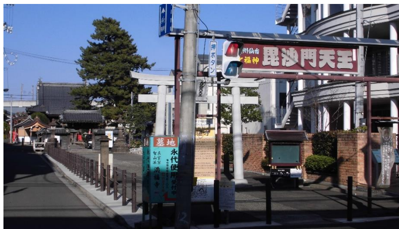
毘沙門堂のある満福寺