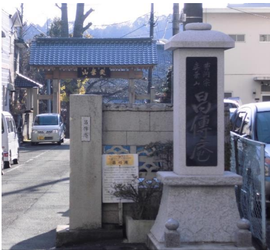
殿様の籠の残る昌傳庵