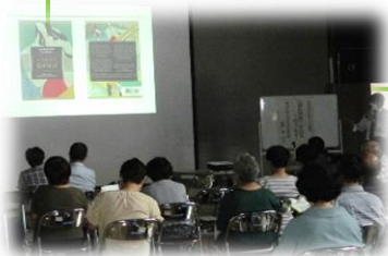
源氏物語を知る (R5年7月)