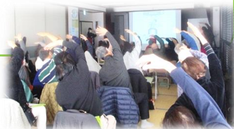
フレイル予防 (R6年2月)