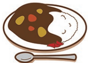
かしーライスもちゃんこ?

おすもうさんは自分たちが食べるりょうりのことを「ちゃんこ」という。ウソかホントか?