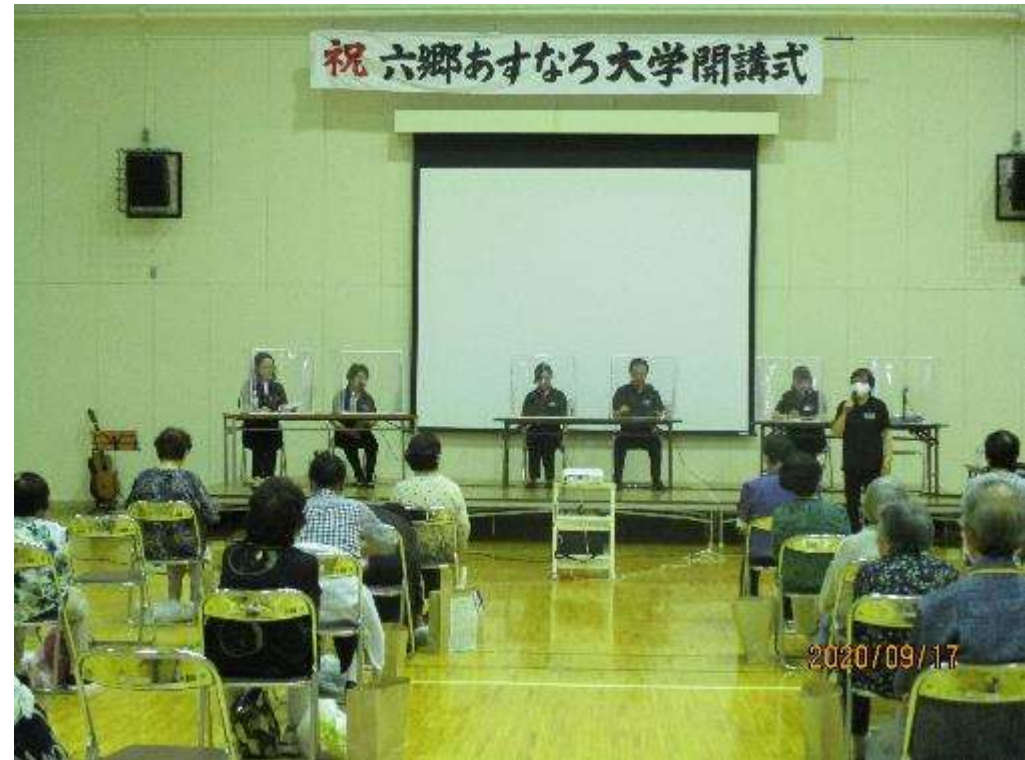
朗 読 劇 (藤沢周平を読む)