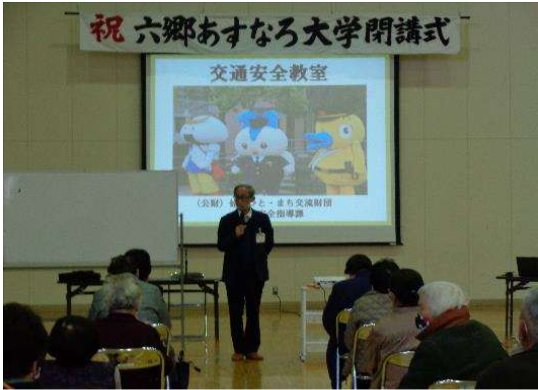
交通安全と防犯教室