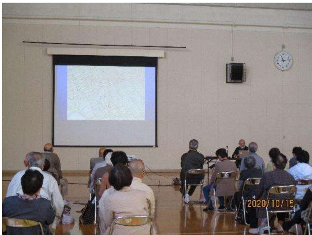
伊達政宗のまちづくり 城下町仙台のヒミツ