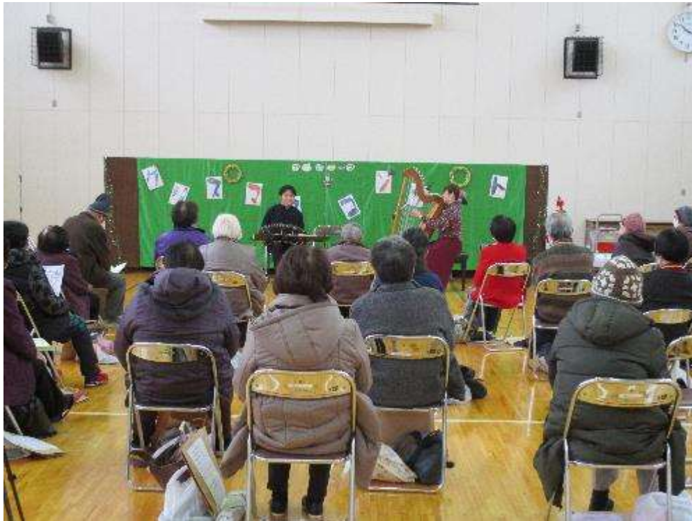
バンドネオンとアルパ コンサート