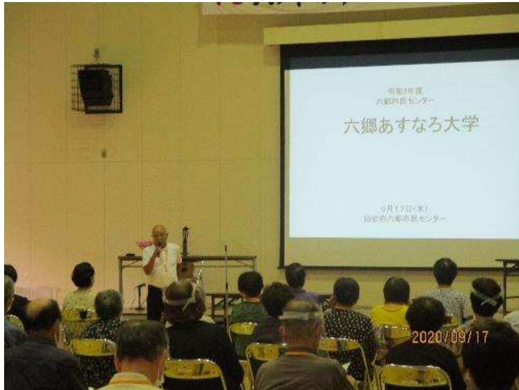
開 講 式