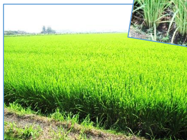
↑なないろの里からの風景