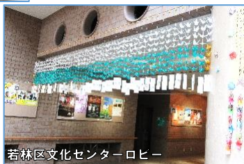
若林区文化センターロビー

七夕飾りは9月末まで飾る予定です。色々な飾りがありますので、お近くにお越しの際はぜひご覧下さい。